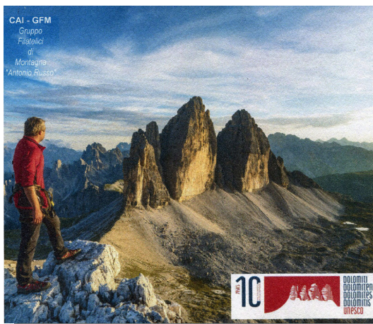
Le Tre Cime di Lavaredo viste dalla vetta del Paterno

Ricorrendo il X anniversario delle Dolomiti Patrimonio dell'Umanità- UNESCO è stato predisposto uno speciale annullo dedicato, oltre a una busta e una cartolina ufficiali ( Montagna in Rosa - serie n° 6/01)